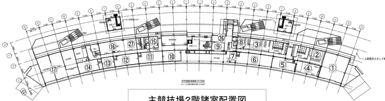
主競技場2階諸室配置図